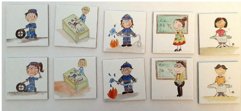
Paveikslas 1: Atminties žaidimas "Active.All"

http://aktivni-vsi.enakostspolov.si/spomin